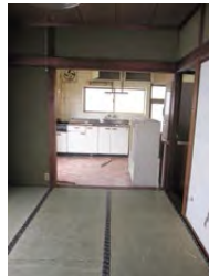
| BEFORE |

家の骨格である構造躯体がしっかりしていれば新築同様に間取りや内装の変更、好きなインテリアへの衣装替えも可能です。リフォームやリノベーションだからこそできる住まいへの可能性を追求してみませんか？