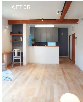
和室との建具で暗く閉ざされていたキッチンが開放的なLDKに生まれ変わりました