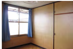
時の流れを感じる子ども室がニッチ棚も備えた明るい子ども室に生まれ変わりました