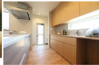
◆K様邸/2018年9月入居 ご家族構成/ご夫婦・お子様3人