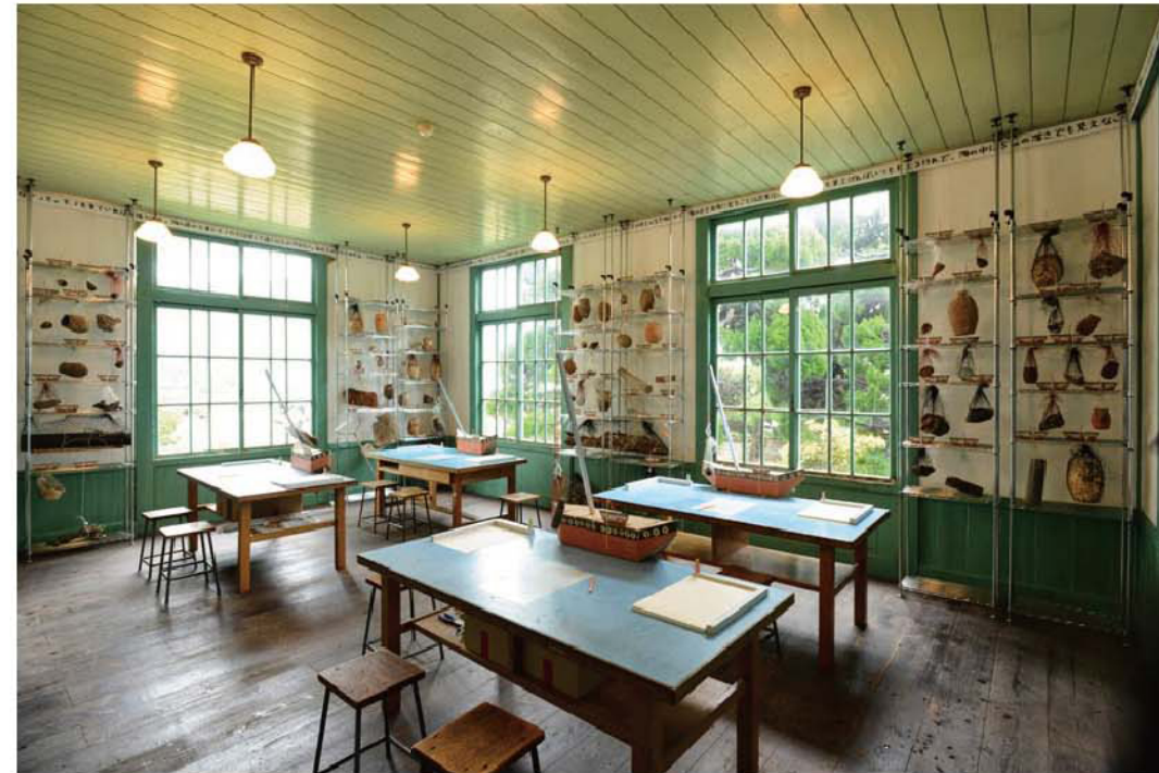
日比野克彦「瀬戸内海底探査船美術館プロジェクト『ソコソコ想像所』」

私たちが美しい晴れの国に生まれた事を誇りに思うきっかけをもらった瀬戸内国際芸術祭に感謝をしています。