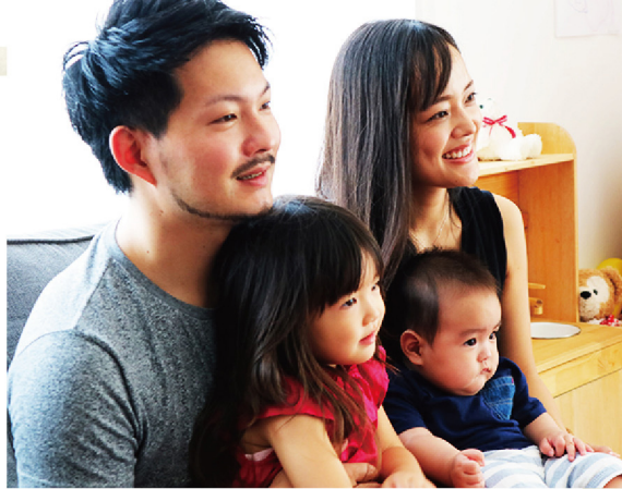
●S様邸/2018年8月入居 ご家族構成/お母様・ご夫婦・お子様2人

※「ウェルビーイング」とは 幸福であり、身体的・精神的に安定しており 満足できる生活状態のこと