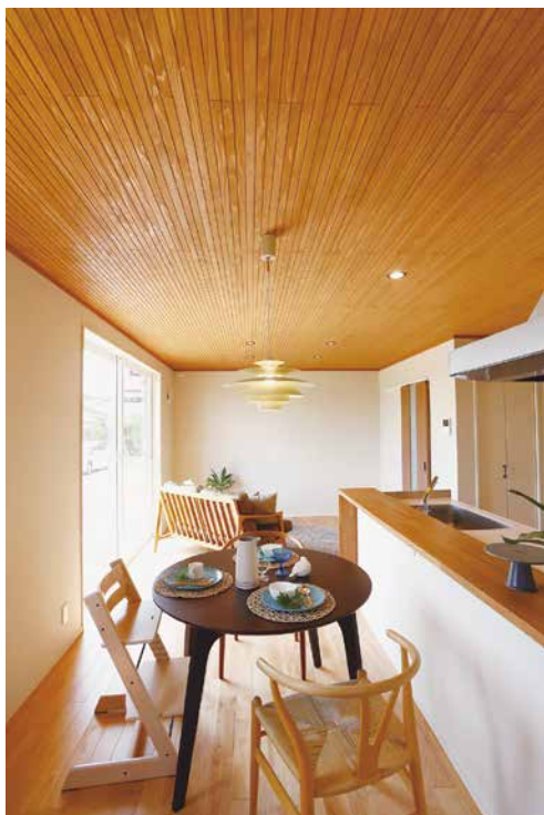
あえて”基地”と呼びたくなるようなモダンな外観。自然素材をふんだんに使った内装との意外性が楽しい。