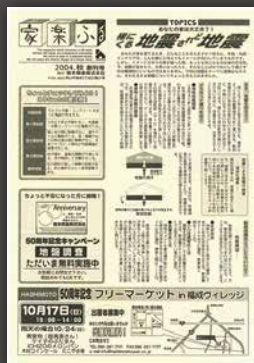
2004 年秋「家楽ふる」創刊号

カラフルが創刊されたのは 2004 年秋号、平成 16 年のことです。創立 50 周年を記念して、ハシモトホームズで家を建てて頂いた方に向けての、コミュニケーションツールとして発行がスタートしました。暮らしを楽しく、安心して暮らして頂くために、「家楽ふる」と名づけました。初版のテーマは「地震」。住まいづくりはイメージが先行してしまう中、同じように大切な安全性も伝えたい内容になっています。現在とは違って、色紙に黒で印刷した親しみのある見栄えですね。毎号お客様へのお便りとして、社内で原稿作りや発送作業を行っていました。