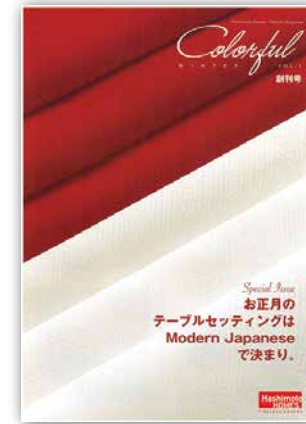
2012 年正月号「カラフル」創刊

そして転換期を迎えた 2007 年。ハシモトホームズはデザインコンセプト「タイムレスモダン」を掲げ、ビジュアルの強化に伴い、2012 年正月号で新しい形に生まれ変わりました。暮らしを豊かにするライフスタイルをテーマに、日常にプラスしてほしいちょっとしたウキウキやオシャレを発見して欲しいキッカケツールとして、現在のカラフルの基盤となるものになりました。家を楽しむ=(イコール)暮らしを楽しむに繋がるからです。